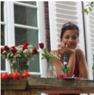
Ein sichtlich zufriedener Gast